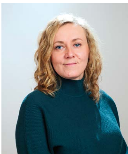
Dul Anna Okręg nr 11