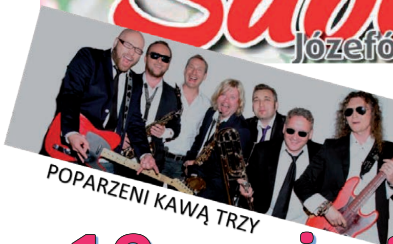
POPARZENI KAWĄ TRZY